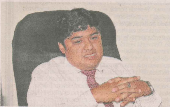
Magistrado es objeto de varias investigaciones.

ACCIDENTE QUERECOTILLO ANIMADOR INVESTIGAN A JUEZ SULLANA ROBO AGRAVADO