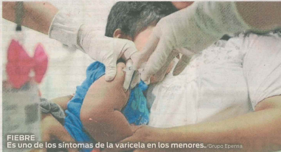
FIEBRE Es uno de los síntomas de la varicela en los menores.

Las dosis serán enviadas a los principales hospitales que funcionan al interior de la región y serán incluidas en el esquema de vacunación, previa capacitación del personal de salud, así-